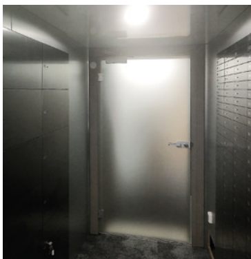
Abbildung: Clavis Sonderausführung Tagesgittertür

Standardverschluss bei Tagesgittertüren ist ein Profilzylinderschloss. Optional besteht die Möglichkeit der elektrischen Türöffnung durch einen elektronischen Türöffnerkontakt und die Zwangsverschiebung durch einen aufgebauten Gleitschienenschließer.