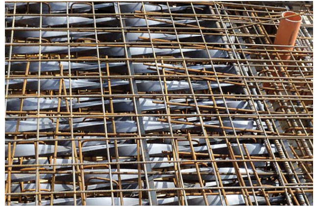
Verlegen der Sicherheitsarmierung