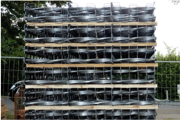
Lieferung des Armierungssystems