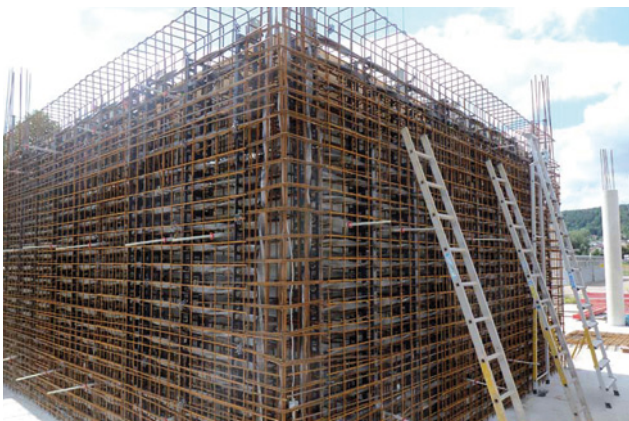
Montage der Sicherheitsarmierung in der Wand