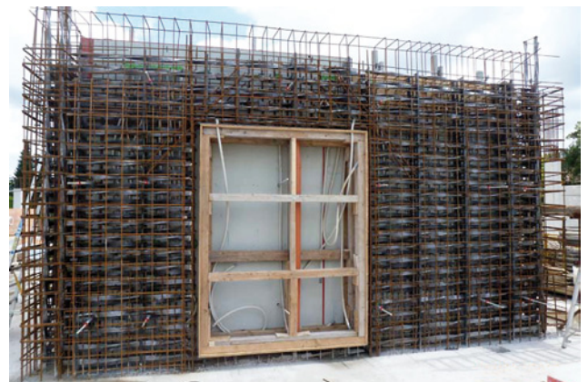
Montageansicht mit Öffnung für Wertschutzraumtür